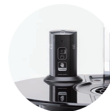
タッチレスセンサー